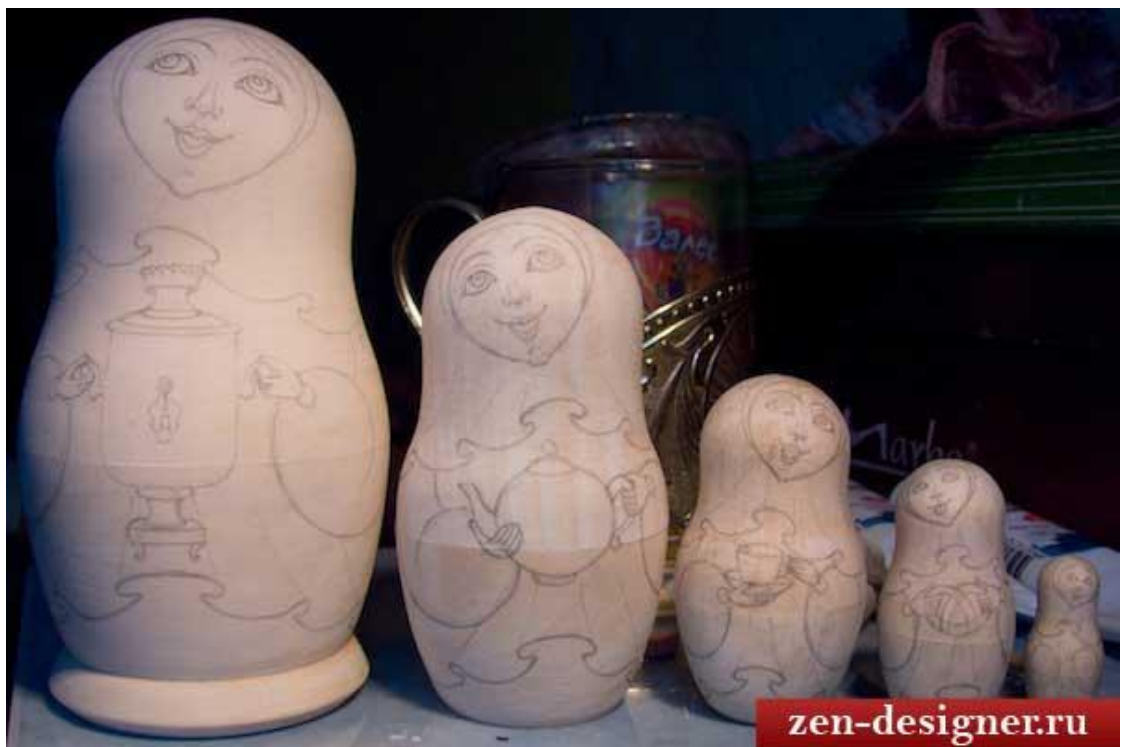
нанесение эскиза простым карандашом