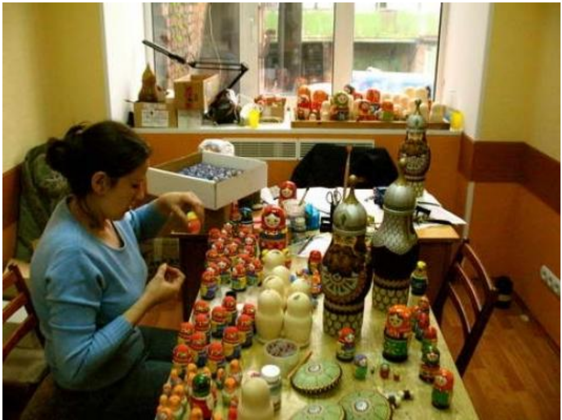
художник за работой